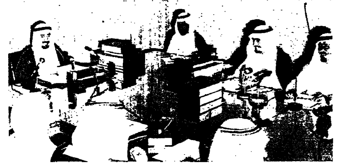
الملك خالد لدى ترؤسه اجتماع مجلس الوزراء للقرار الموازنة، ويبدو الأمير نهد ولي العهد، والوزير عبدالله رئيس الحرس الوطني